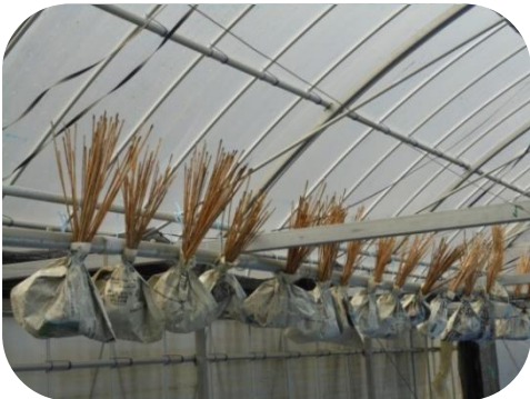
▲ハナニラの種を乾燥させて・・・