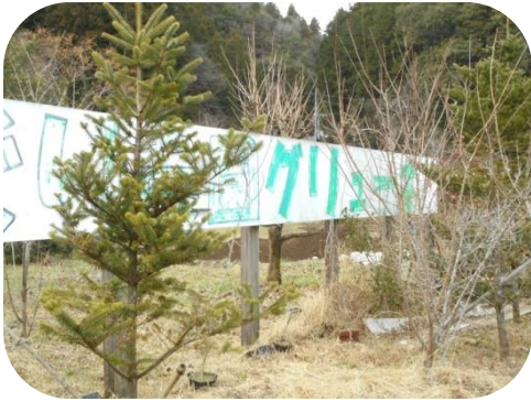
▲看板のそばで「もみのき」も越冬・・・