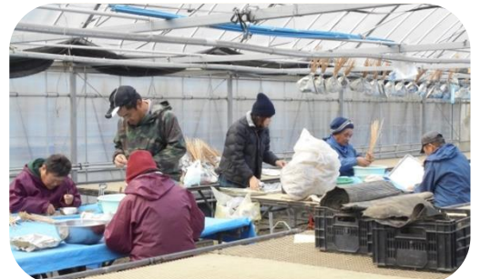
▲「はたらく」ことに真面目です!(^^)!